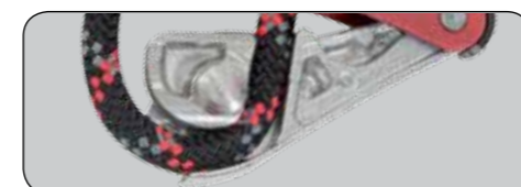
Gewölbte Umlenknocke und zu öffnender Einschub