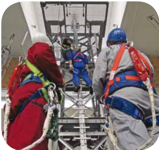
霍尼韦尔提供完整的高空安全培训解决方案

霍尼韦尔设于中国、美国及德国等地的培训中心，可提供一系列定制的高空安全培训，包含理论讲解及实际操作演练，依客户需求可在培训中心或现场举行。