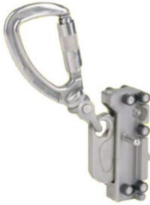
Söll Comfort 2