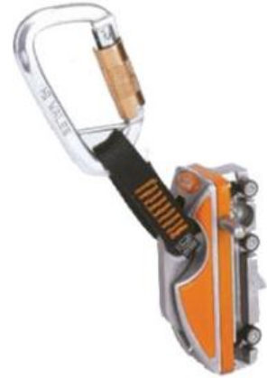
Söll Comfort UK