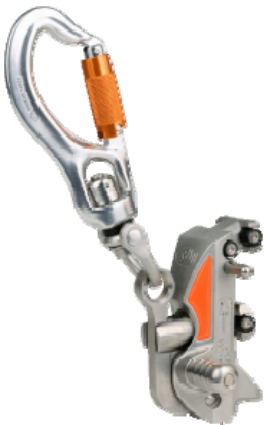
Söll Universal II