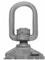
After release/ Après déclenchement

If Failed has been selected at least once, return the block to a Miller Factory authorized Service Center / Si Echec a été coché au moins 1 fois, retournez le Bloc à un Centre Miller agréé