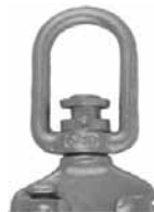
Before release / Avant déclenchement